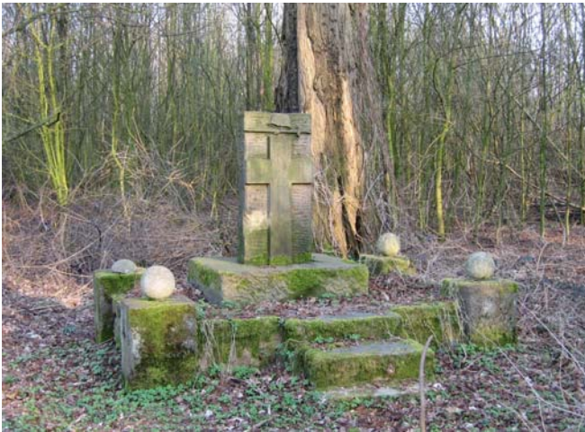
Das Ehrenmal rundete bis in die 50-er Jahre eine kleine Sportstätte mit Fußballplatz, 280-m-Laufbahn, Sporthalle und kleinen Anlagen für leichtathletische Übungen ab.

Die Landser-Vereinigung gab sich „nominell überparteilich“. Laut Meyers Großem Lexikon, war der „Stahlhelm“ „aber tatsächlich national konservativ und neigte zunehmend den antidemokratischen Rechtsparteien zu, mit denen er dann ab 1929 die (Weimarer) Republik offen bekämpfte.“ 1935 wurde der Verein aufgelöst. Da hatten sich die Mitglieder - im längst gleich geschalteten Deutschland - bereits den nationalsozialistischen Organisationen angeschlossen.