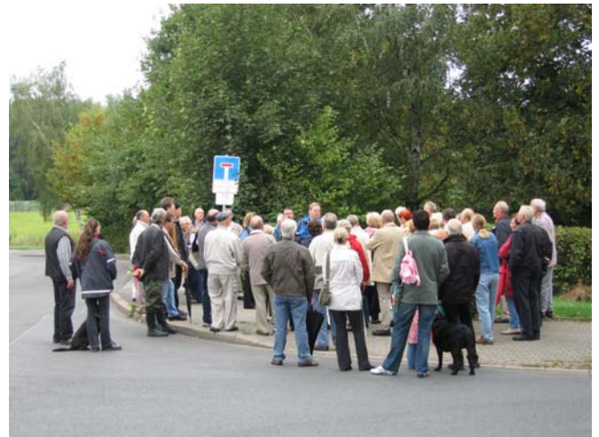
Vor dem Eingang zum jüdischen Friedhof Ecke Siegen-/Groppenbrucher Straße versammeln sich Mitglieder des Heimatvereins zum Schnadegang 2006

Heute befinden sich auf dem Friedhof insgesamt 23 Grabstätten mit Grabsteinen, davon sieben alte Grabstätten aus der Umbettung von Nette. Der regelmäßig gepflegte Friedhof ist von einer Buchenhecke und Zaun eingefriedigt und ist trotz seiner Lage im Kreuzungsbereich Siegen-/Groppenbrucher Straße ein Ort der Ruhe und Stille.