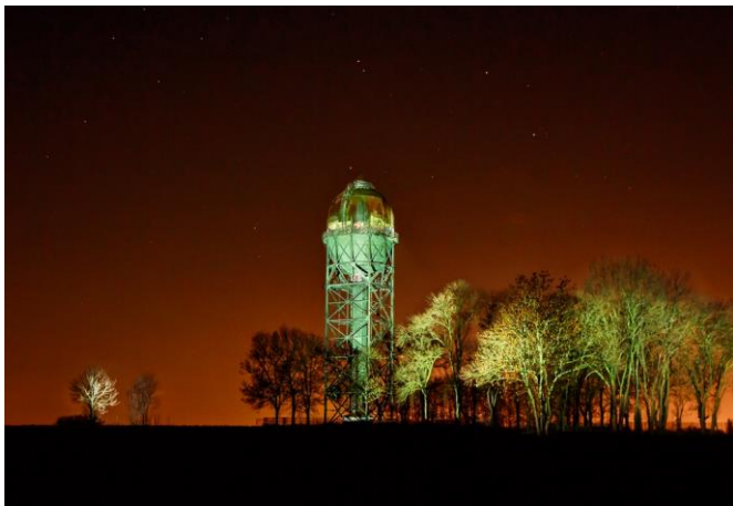
Das „Ei“ bei Nacht

Die Netzlänge und die Kosten von Dein- ghausen sind in den Zahlen von Dingen