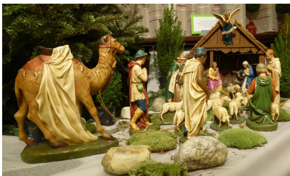
Krippe in der weihnachtlich dekorierten Heimatstube