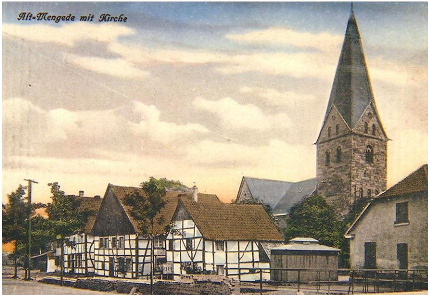
Wiedenhof mit Kirche um 1912

Die jetzt restaurierten und gesicherten Grabplatten erinnern alle an protestantische Pfarrer der Gemeinde. Die älteste verkündet den Tod des Pfarrers Johann Leveringhaus 1628 und vermerkt auf Latein, dass er "Diener des reinen Gotteswortes" gewesen sei. Während