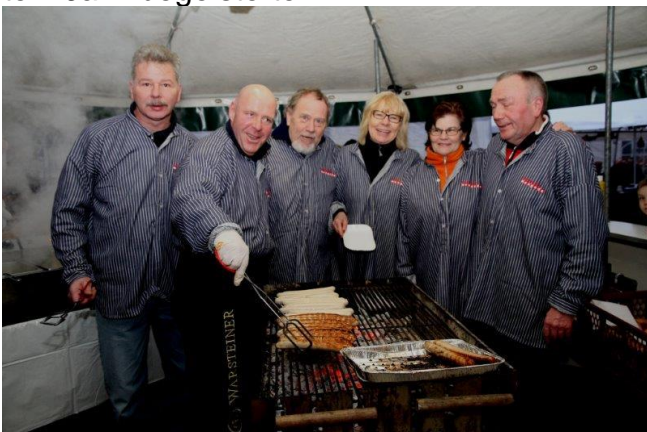
Ohne sie geht nichts: Die dienstbaren Geister