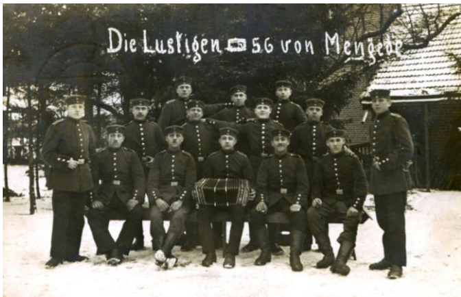
Diese AK erreichte die Heimat im Januar 1918

Die Feldpost (Karte, Brief, Päckchen oder Paket) musste nicht mit Briefmarken versehen werden, sie war gebührenfrei. Kein Wunder also, dass viele Millionen Feldpostkarten, Briefe, Päckchen, Zeitungen und Pakete in beide Richtungen unterwegs waren. Keine leichte Aufgabe für die Feldpostsoldaten, denn die ständigen Verschiebungen der Truppenstandorte führten zu Problemen bei der Zustellung, die schließlich sogar vom Kaiser persönlich gerügt wurden. Die Feldpost war auch ein boomendes Geschäft, denn etwas 250 Anbieter konkurrierten mit ihren Karten um die Gunst der Käufer.