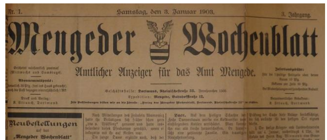
Neujahrsausgabe des Mengeder Wochenblattes 1903

So beschreibt die Amtsverwaltung das Erscheinen eines eigenen Organs in ihrem Verwaltungsbericht 1889 – 1902.